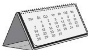
«Домик» с перекидными листами